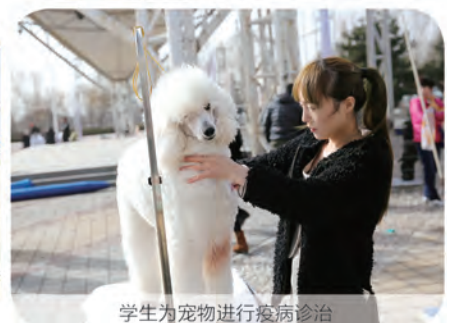
学生为宠物进行疫病诊治