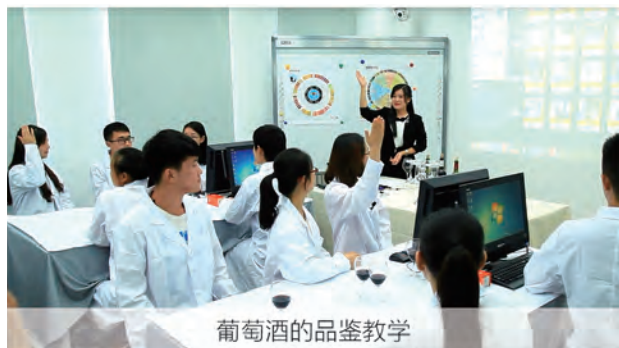
葡萄酒的品鉴教学

面向食品产业链质量安全管理、食品检验、食品加工等企业，培养具备德、智、体全面发展，政治素质、知识和能力结构适应社会经济发展需要，具备食品检测和分析、食品质量管理的基本理论和技能，系统掌握食品安全、食品标准与法规、食品质量控制及安全检测技术等知识与能力，能从事食品安全检测（包括食品快速检测、食品智能化安全检测）和食品质量控制等工作，能适应食品安全检测领域的发展需求，具有较强的创新精神、团队合作意识、实践能力和沟通艺术的“通食品、强检验、善管理”三位一体的高端技术及管理应用型人才。