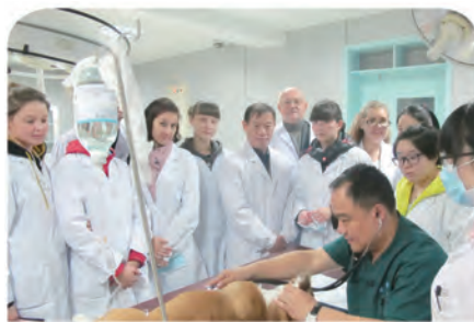
俄罗斯沃罗妮日农业大学师生来动物医院学习