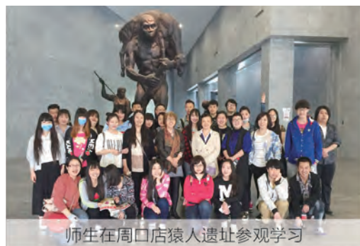
师生在周口店猿人遗址参观学习