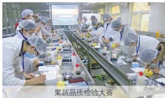
果蔬品质检验大赛