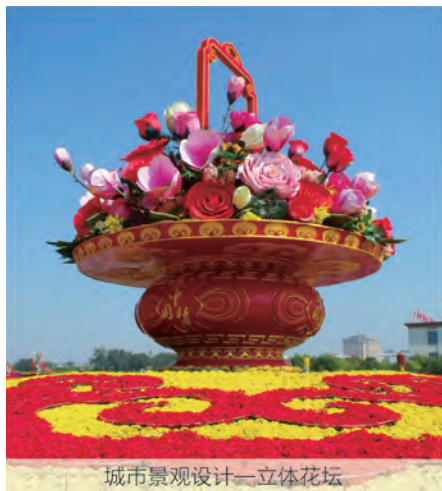
城市景观设计—立体花坛