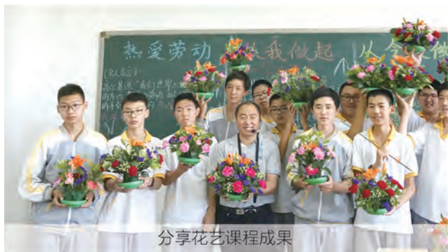
分享花艺课程成果

面向花卉艺术设计行业的经营管理，从事室内（花店业、酒店业、展览业）、室外（景观造型及养护管理）植物装饰设计与现代都市农业观光园的规划设计及管理，或创业成立花艺工作室或景观设计公司，从事花艺景观设计等。