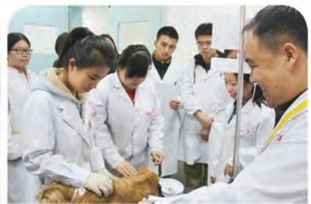
学生在动物医院学习