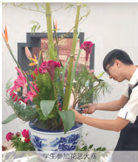
学生参加花艺大赛