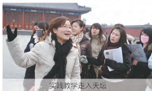
实践教学走入天坛