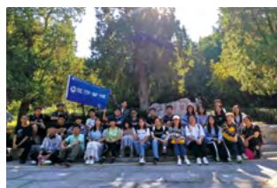
北京工商大学旅游管理专业师生参观双清别墅