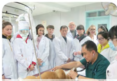
俄罗斯沃罗妮日农业大学师生来动物医院学习

毕业后可从事宠物疾病的预防、诊断与治疗、宠物美容与护理、动物卫生监督管理和动物防疫检疫、食品安全生产与管理与安全卫生检验、兽药残留检测、畜产品进出口贸易、现代都市伴侣动物生活指导等相关领域工作。