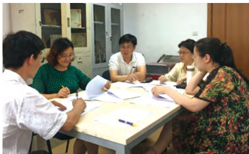
与北京工商大学生物工程专业对接研讨人才培养