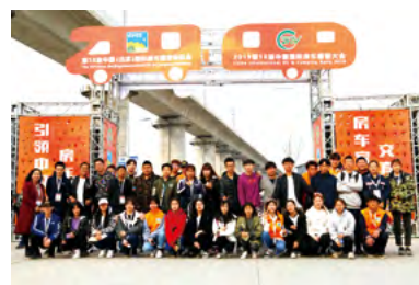
贯通学生旅游专业实践学习