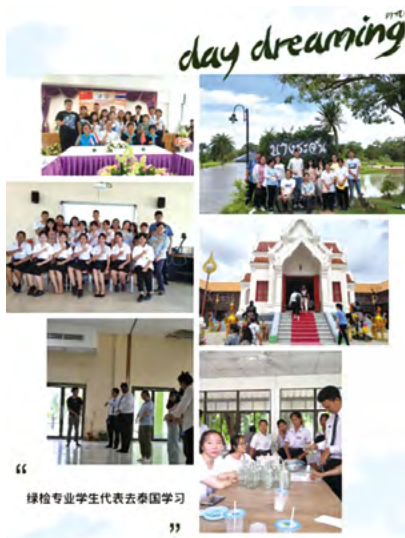
国际交流合作组图