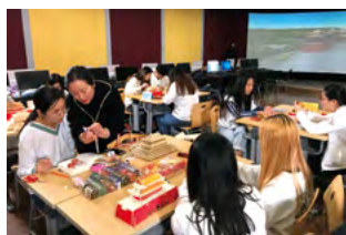
景点模型搭建教学