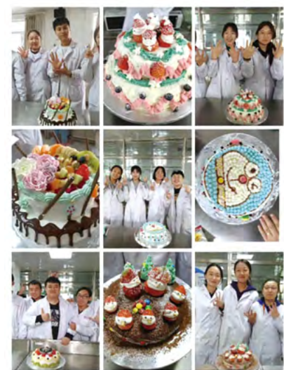
烘焙食品学习制作组图