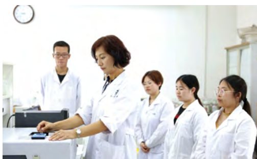
教师指导学生实训