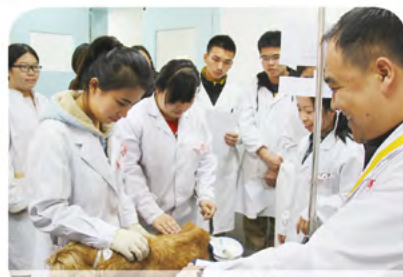
学生在动物医院学习