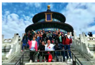
天坛景区实践教学