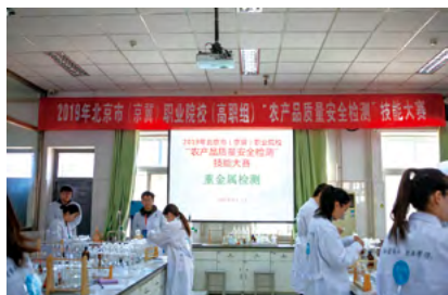
承办北京市（京冀）职业技能大赛

GREEN FOOD PRODUCTION AND INSPECTION (FOOD SAFETY DETECTION TECHNOLOGY)