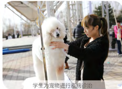
学生为宠物进行疫病诊治